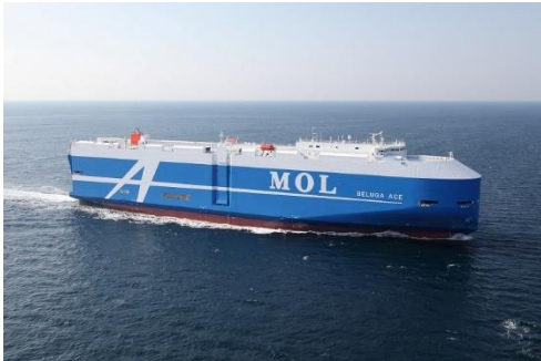
商船三井の次世代型自動車船「BELUGA ACE」 6,800 台の自動車を一度に輸送可能(小型車換算)